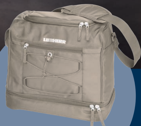
Chladičí taška Liebherr ke každé objednávce

Obdržení chladičí tašky do 3 týdnů od potvrzení registrace.