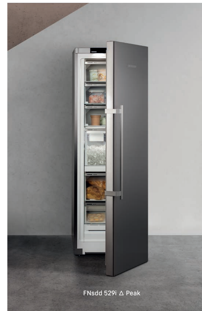
FNsdd 529i Δ Peak

Opravitelnost jako další znak dlouhé životnosti. Větší udržitelnost zajišťujeme nejen dlouhou životností našich spotřebičů, ale také jejich snadnou opravitelností. Po ukončení výroby příslušného modelu tak zaručujeme 15letou dostupnost náhradních dílů. Ta platí pro všechny funkční díly a skladatelné díly vybavení.